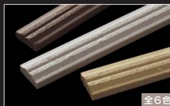
セラヴィオW (ライン面ポーター)

焼き物らしい『土もの』の質感が、和モダン・洋風住宅の全面タイル貼りにお薦めです。