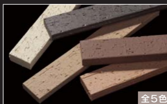
セラヴィオR (ラフ面ポーター)

焼き物らしい『土もの』の質感が、和モダン・洋風住宅の全面タイル貼りにお薦めです。