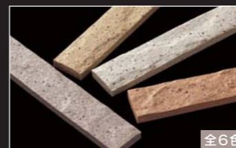
セラヴィオM (石面ポーター)