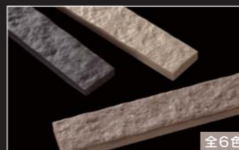
セラヴィオS (割肌面ポーター)