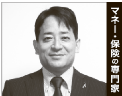
マネー・保険の専門家