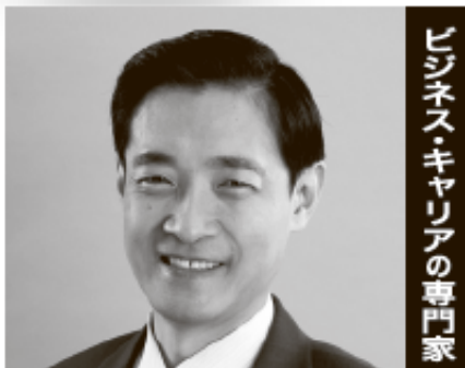
ビジネス・キャリアの専門家