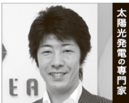
太陽光発電の専門家