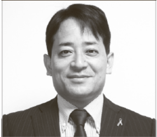
生命保険・損害保険の スペシャリスト