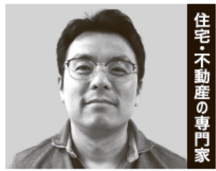
住宅・不動産の専門家