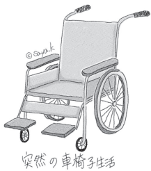
突然の車椅子生活

狐に摘まれた様な話ですが本当です。ご加入の生命保険会社に聞いてみましょう。「延長(定期)保険」にできる契約ならば、今まで通りの保険料で夫の介護保障の保険料にでき、妻は今まで通りの保障が満期まで有ります。受け取る介護保険金は非課税(無税)で、今後の治療費に使えます。介護保障の保険はお勧めです。「延長(定期)保険」に出来ない場合はご相談ください。 ※「延長(定期)保険」とは、養老保険の解約返戻金を一時払の保険料にして、養老保険から定期保険に変更することです。